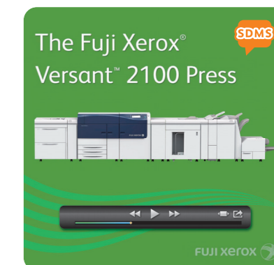
SkyDesk Media Switchアプリ(ダウンロード無料)で動画をご覧いただけます。使い方はP2をご覧ください。