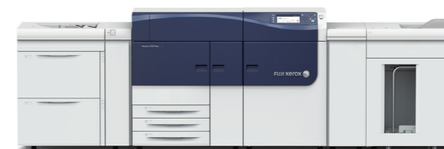
※Versantは米国ゼロックス社の商標です。

プロ市場向けに機能を厳選し、コンパクトなボディに凝縮して搭載。また、デジタル画像処理技術を刷新し、さらなる高画質を実現したコストパフォーマンスに優れたA4カラー100ページの高速印刷が可能なスタンダードモデルです。